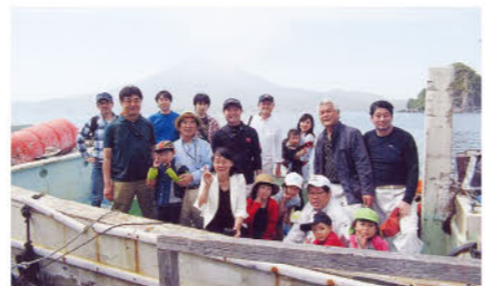
大隅振興議員連盟の家族と共に