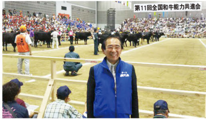
仙台夢メッセみやぎ会場にて(畜産振興議員連盟として参加)

当日、胸が熱くなり感動し、喜びでいっぱいになりました。関係各位の御努力に改めて心から感謝をいたします。