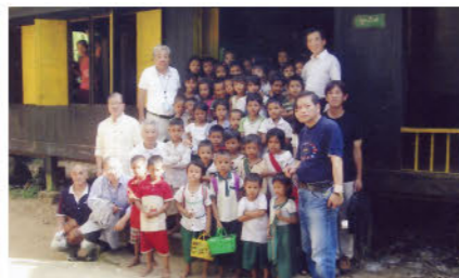
友人と共にミャンマーの小学校を慰問